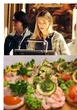
samtalegudsteneste og fest