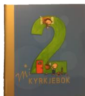
2årssamling og -bok