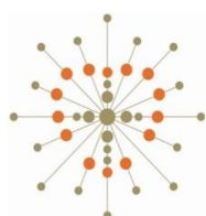
brev om dåp