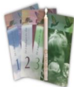
brev frå kyrkjelyden ved 1, 2 og 3årsdag for dåp