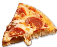
pizzafest eller ekstraundervisning eller ikke no?