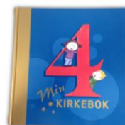
4årsbok og søndagsskulens dag