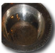
dåpsamtalar og dåp