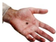
gruppesamling: Stod Jesus virkelig opp frå dei døde?